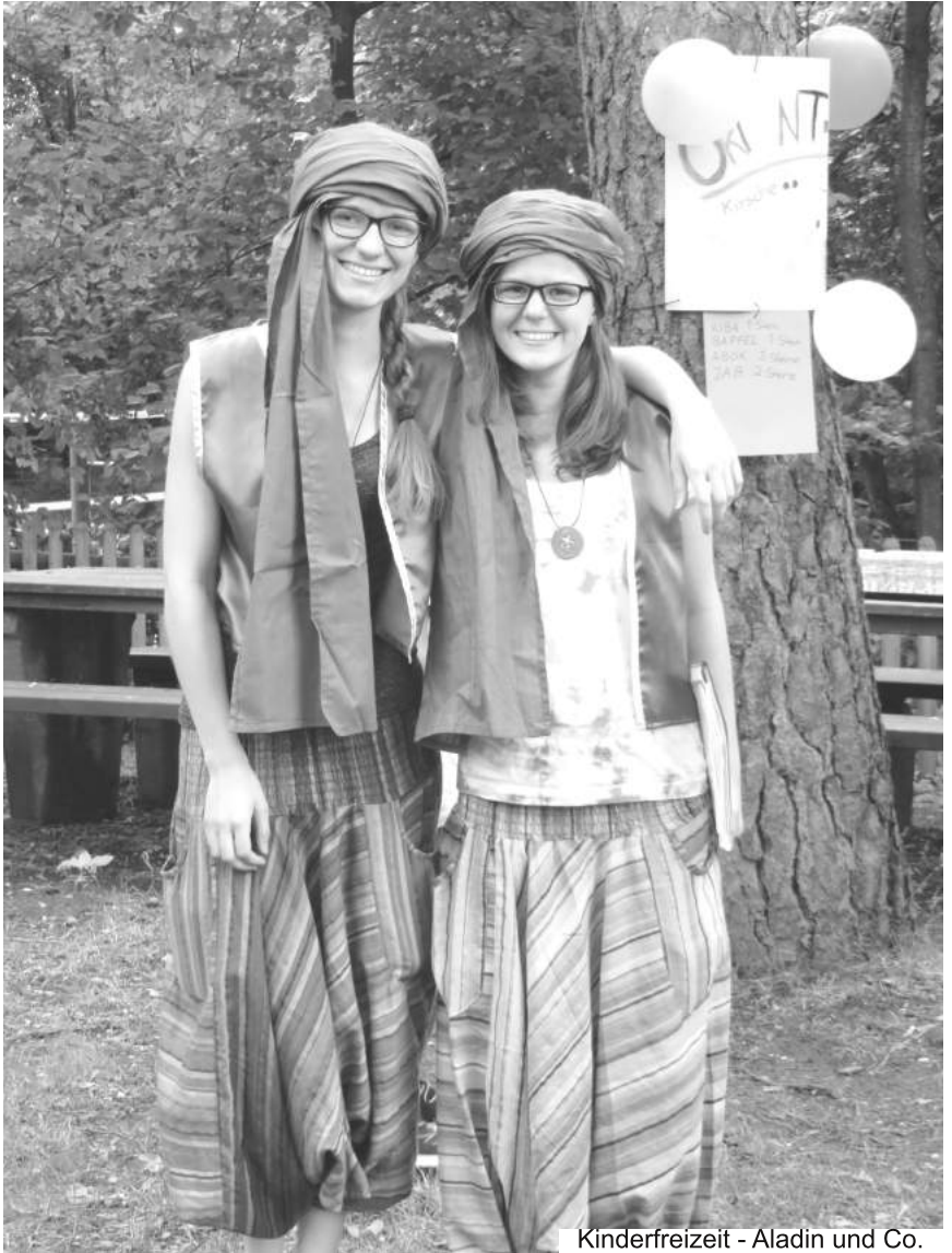
Kinderfreizeit - Aladin und Co.

Landeskirchliche Gemeinschaft e.V. Bezirk Schaumburg