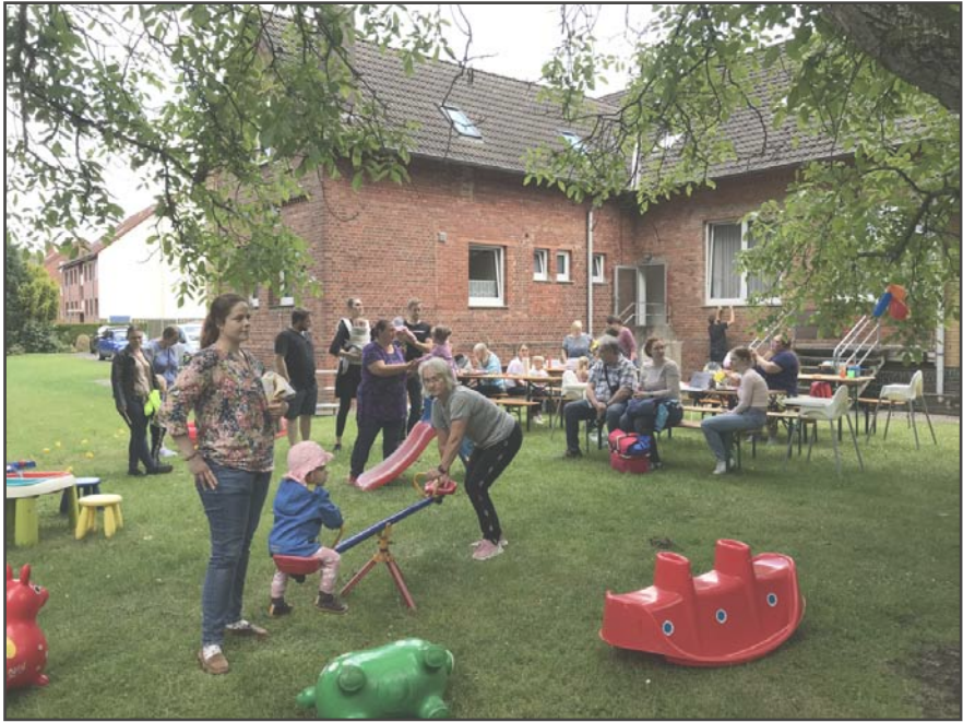
Rege Teilnahme beim Sommerfest der Knirpse. Kinder, Eltern und Großeltern ließen sich einladen.